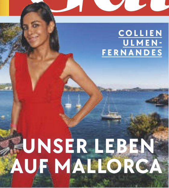
COLLIEN ULMEN- FERNANDES