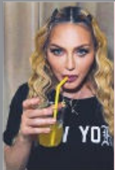
MADONNA So will sie jetzt zu Kräften kommen

SONJA ZIETLOW Glücks-Geheimnis ihrer langen Ehe