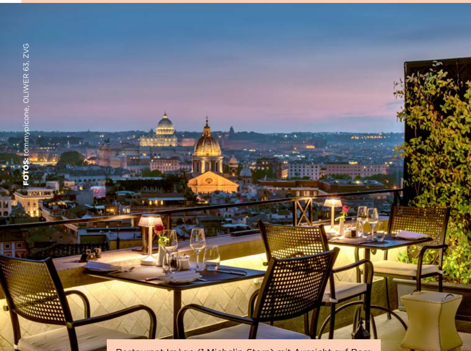
Restaurant Imàgo (1 Michelin-Stern) mit Aussicht auf Rom